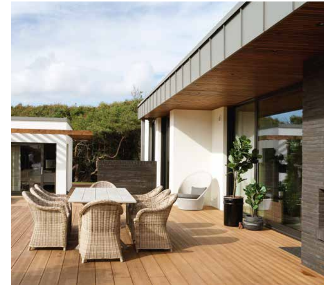
I det kompletterande attefallshuset (till vänster) finns det plats för gäster eller parets vuxna barn när de är på besök.

– Huset blev bättre än jag tänkte mig. Jag var lite nervös för materialvalen, det är svårt att föreställa sig dem innan de kommer på plats. Men det blev bra, vi har fått mycket beröm för att allting är så snyggt ihop.