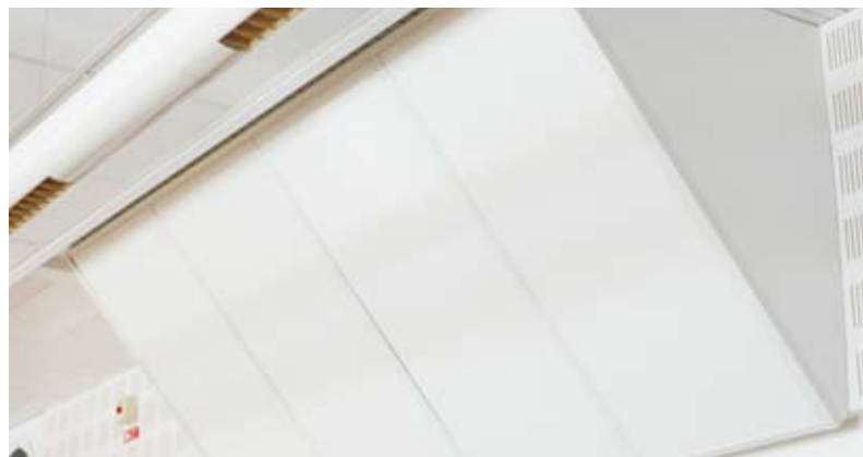
DOUBLE ABSORBENT med monterat ändavslut.