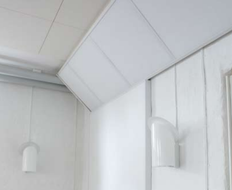
DOUBLE ABSORBENT monterad i lunchrum.